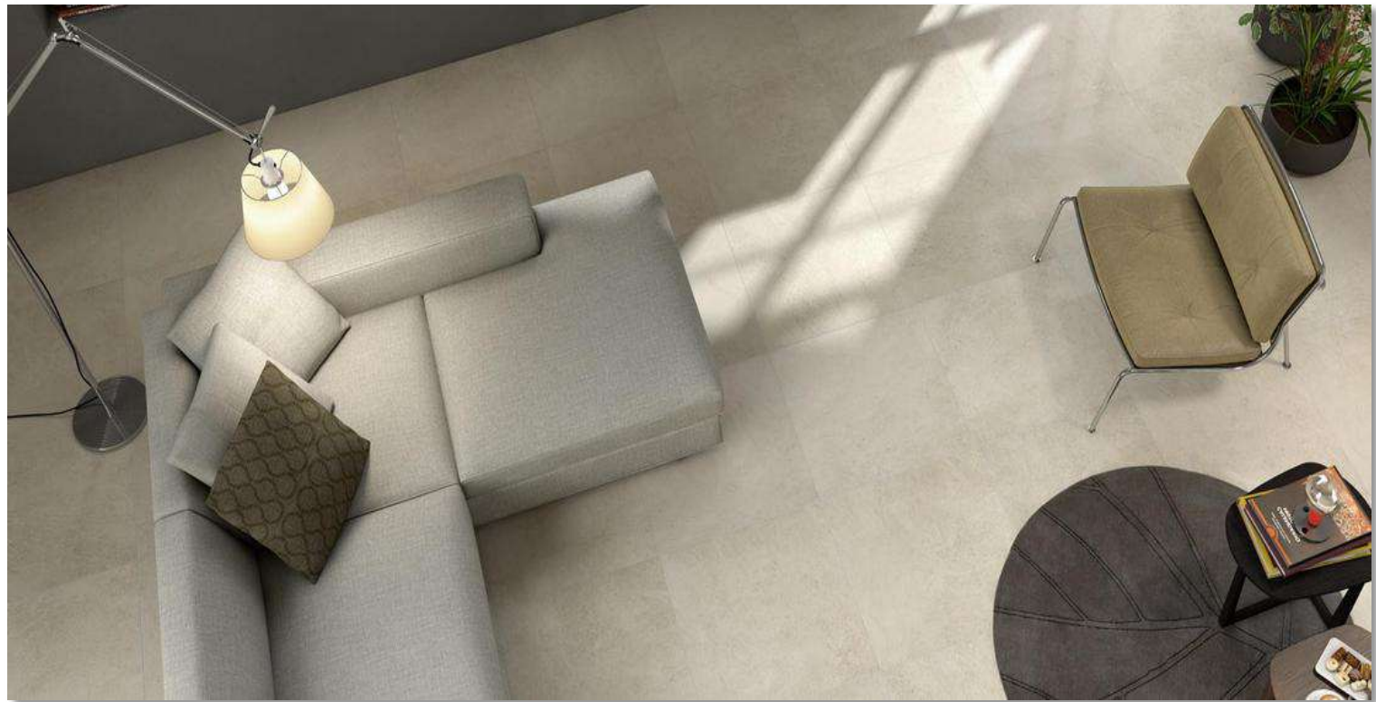
Esempio di ceramiche

In tutti i locali pavimentati interni, è prevista la posa di uno zoccolino battiscopa in legno.